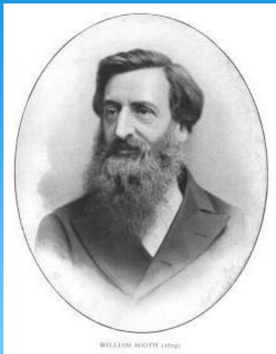
General William Booth Founder of the Salvation Army 救世軍的創辦人

「讓神擁有我所有的一切。世上有許許多多的人頭腦比我大比我好...但是從我第一天心中掛念到倫敦的窮人而且想到這是神能使用我的異象開始，我就決定讓神擁有我的一切。」