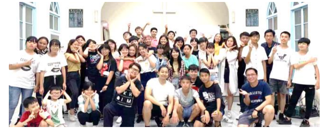
台灣短宣隊員與當地助教和孩子們