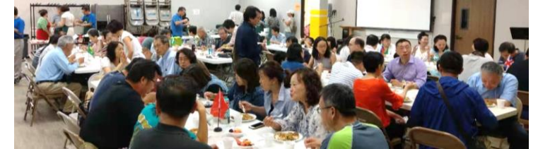
8/10 宣教週各團契/區 potluck 晚餐