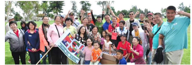
9/28 野餐趣味活動中表現優異的東南區&ESL 隊

❖ 求是現在式，給是將來式，你永遠不知道，上帝會在哪個時刻，讓你的禱告蒙應允。~主知名 請踴躍參加週三禱告會，本週為恩典、好消息、東南區三個團契禱告。