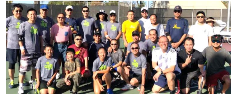
10/20 網球比賽參賽選手