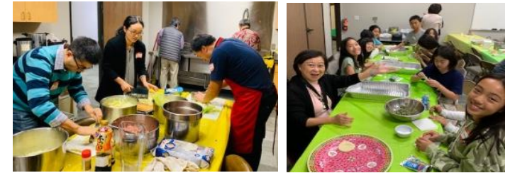
11/10 兒童部五、六年級包水餃活動